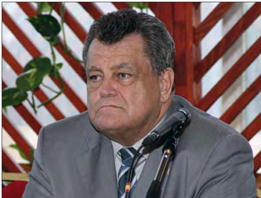
Az MGYOSZ elnöke szerint három húzóágazata lehetne az országnak

ség van. Mint azt a miniszter elmondta, tárcájánál több programmal is élére kívánnak állni a kormányzati reformszándékoknak. Az egyik ilyen, ami vélhetően nagy konfliktusok okozója lesz, az átfogó energetikai reform. Kiemelte: ma már nem lehet tekintettel lenni arra, hogy szerzett jogok, funkcionális vagy valódi monopóliumok határozzák meg a fogyasztók lehetőségeit. Az energetikai piacnyitás lényege, hogy az importőrtől a szolgáltatóig minden egyes ponton induljon be a verseny, a legkisebb fogyasztóért is. A politikus azt a szándékát is hangsúlyozta, hogy a Gazdasági és Közlekedési Minisztérium élen járjon az intézményi közigazgatást érintő reformok előmozdításában. Egyetértett azokkal a véleményekkel, amelyek szerint 2004 és 2006 között a pályáztatási rendszer nem felelt meg a vállalkozások elvárásainak. Pedig erre szükség van. Ha ugyanis az 1000 milliárdos állami kiadáscsökkentés és szintén 1000 milliárdos külföldi tőke beáramlása mellé sikerülne a lehető leggyorsabban, a legnagyobb hatékonysággal lehívni azt a további 1000 milliárd forintot évente, ami az unióból érkezik Magyarországra transzferek formájában, akkor semmi nem akadályozhat meg bennünket abban, hogy 2010-re ismét a régió leg-