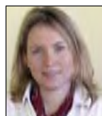
Az összeállítást készítette: Lotos Adrienn állandó képviselő

A UNICE szerint az európai vállalatoknak egyértelmű érdeke az integrált és koherens energiapolitika kidolgozása. A szervezet ezért üdvözölte a bizottsági javaslatot, de több alapelvre is felhívta a figyelmet. Így például arra, hogy a kezdeményezéseknek meg kell felelniük a piacgazdaság követelményeinek és az EU versenyképességének. Minden opciót, így a nukleáris energiát is, számításba kell venni. A szövetség szorgalmazza az aktív uniós külpolitikai egyeztetést az energiaellátás területén. Azt is elvárja, hogy a közösség átgondolt, a meglévő jogszabályi keretekkel összhangban lévő intézkedéseket javasoljon. Annak érdekében, hogy ne alakuljon ki veszélyes és káros függőség egy külső ellátó ország irányában, a UNICE javasolja a transzatlanti és az orosz együttműködések szorosabbra fűzését, valamint a külkereskedelem, a fejlesztés és a diplomácia erősítését a tagállamok között és az Európai Bizottságon belül is.