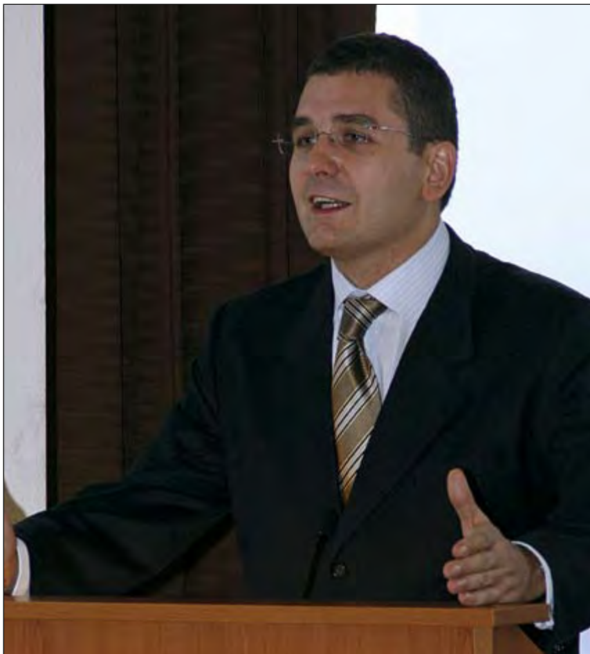
A kiszámíthatóság a legfontosabb politikai feladat

Mi szükséges a versenyképesség erősítéséhez? – egyebek mellett erre a kérdésre kereste a választ a legutóbbi MGYOSZ-csúcstalálkozó vendége, Kóka János. A gazdasági és közlekedési miniszter hangsúlyozta: vége annak a korszaknak, amikor hibás döntések sora terhelte túl a költségvetést, és növelte finanszírozhatatlan mértékben a szociális kiadásokat.