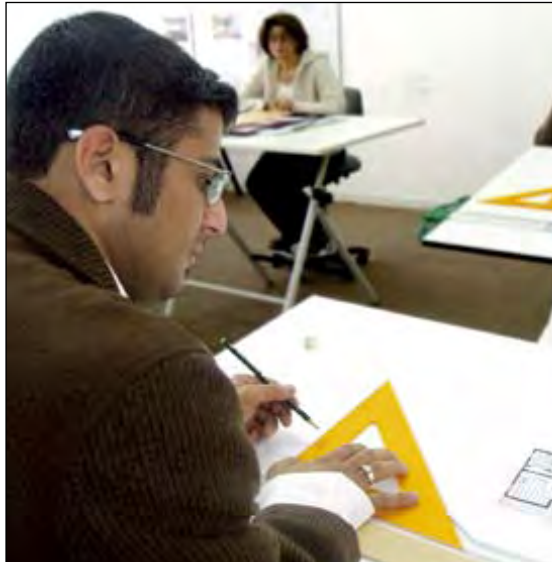
Karriertervezés: érdemes minél előbb elkezdni

Az állásbörzéhez hasonló sikeres rendezvények azért fontosak, mert ha manapság egy friss diplomás megjelenik a munkaerőpiacon, több kihívással is szembe kell néznie. A Központi Statisztikai Hivatal adatai szerint a munkanélküliségi ráta hazánkban 7,5 százalékos; a munka-