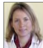
Az összeállítást készítette: