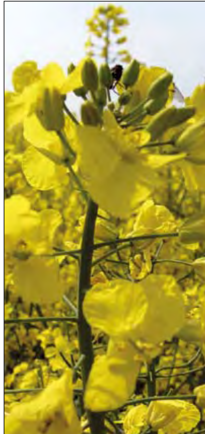
Kitörési pont lehet a bioenergia

A gabonafélékből jó hatásfokkal nyerhető bioetanol, előállításának sokkal kedvezőbbek az ökológiai és piaci feltételei Magyarországon, mint a növényiolaj-bázisú motorhajtó anyagokénak. Bioetanolból és származékaiból a hazai szükségleten túl jelentős exportra is van lehetőség, amennyiben a biztos alapanyagbázisra jelentős gyártókapacitások