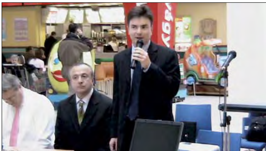
A Re'lem Kht. szolgáltatását valamennyi elemforgalmazó vállalkozás igénybe veheti

A Re'lem ezeken túl arra is törekszik, hogy megfeleljen a lakossági elvárásoknak kényelmesen elérhető gyűjtőhelyek kialakításával és a hulladék szakszerű ártalmatlanításával. A kht. jelenleg több mint 5000 gyűjtőpontot működtet országszerte bevásárlóközpontokban, üzletekben, önkormányzati és oktatási intézményekben. Fontos feladatának tartja a felnövekvő generációk szemléletének formálását is: rendszeresen szervez iskolák számára országos hasznátelelem-gyűjtő versenyeket, ahol a legtöbbet gyűjtő iskolák és osztályok technikai berendezéseket, osztálykirándulásokat, színházlátogatást és kalandtáborban való részvételt nyerhetnek. Legutóbbi versenyükön 609 iskola csaknem 42 tonna használt elemet gyűjtött. A Re'lem szerint ezzel körülbelül 220 ezer diákhöz sikerült eljuttatni azt az üzenetet, hogy környezetünk védelme érdekében a használt elemeket és akkumulátorokat lehet és kell is szelektíven gyűjteni.