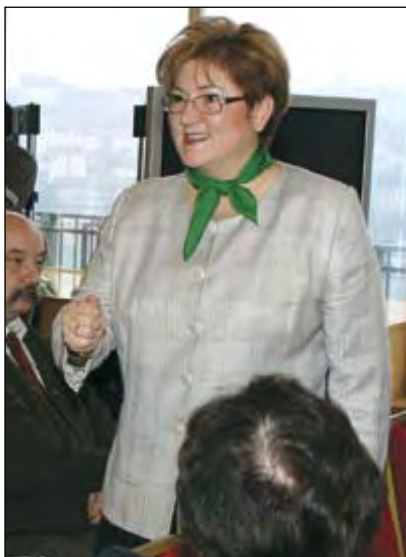
A színvonalas közigazgatás erősíti a versenyképességet

A miniszter hangsúlyozta, hogy az önkormányzati és az államigazgatási szolgáltatás színvonala meghatározza az ország versenyképességét. Ezek közé a szolgáltatások – államigazgatási funkciók ellátása – közé tartoznak a vállalkozók működését befolyásoló rendelkezések, eljárások, döntések is. Lamperth