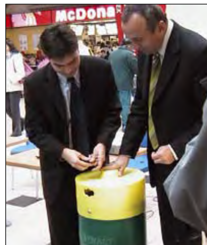
Szelektíven kell gyűjteni