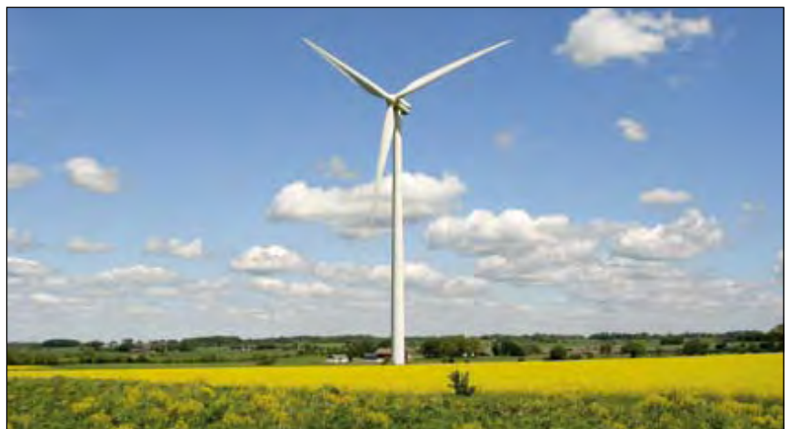
A szélenergiát kevésbé preferálják a fejlesztési tervek, mint a biomasszát

Az unió azt tervezi, hogy 2010 utánra felfelé módosítja a hagyományos motorhajtó anyagokba bekeverhető biomotorhajtóanyagok részarányát. Elképzelhető a 10 százalékos bekeverés is. Az előzőekből is látszik, hogy közösségi és nemzeti érdek is, hogy a biomotorhajtó anyagok előállítása növekedjék. A jelenlegi direktívák figyelembevételével az EU összes éves motorhajtóanyag-felhasználását alapul véve 2010-re az uniónak 12 millió tonna bioetanolból előállított benzinre és 16 millió tonna növényi olajokból előállított, a dízel üzemanyagokba keverhető biogázolajra lesz szüksége. Ez azt jelenti, hogy a jelenlegi bioetanol-előállítást meg kellene ötszörözni, a biodízelgyártást pedig legalább meg kellene háromszorozni az EU-tagországokban. A biomotorhajtó