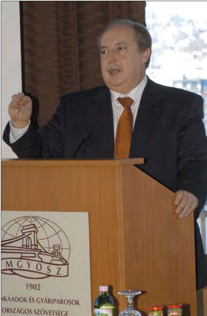
Egy új társadalmi együttműködés megteremtése a legfontosabb feladat

A Munkaadók és Gyáriparosok Országos Szövetsége év eleji csúcstalálkozóján Kiss Péter szociális és munkaügyi miniszter adott tájékoztatót a foglalkoztatás időszerű kérdéseiről.