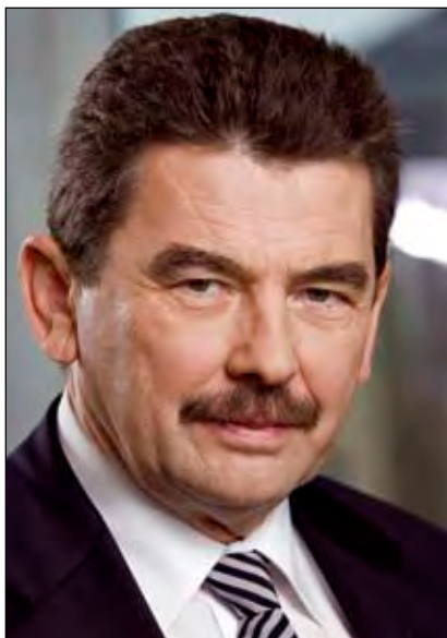
Mosonyi György, az MGYOSZ alelnöke, a Mol Nyrt. vezérigazgatója

A kereslet-kínálat törvényei és az olajipar