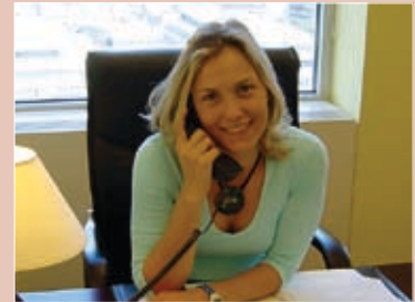
A Brüsszeli Híradó összeállítását szerkeszti:

– például az EBB-csoporttal együttműködésben biztosított innovatív finanszírozási eszközök – mozgósításával, ezáltal is ösztönözve a reformokat.