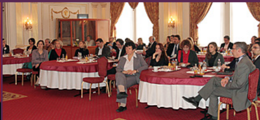
► A közönség