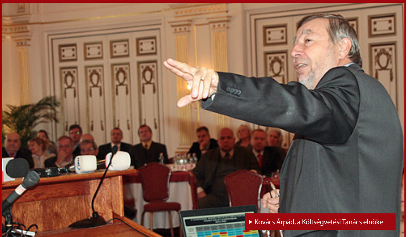
▶ Kovács Árpád, a Költségvetési Tanács elnöke