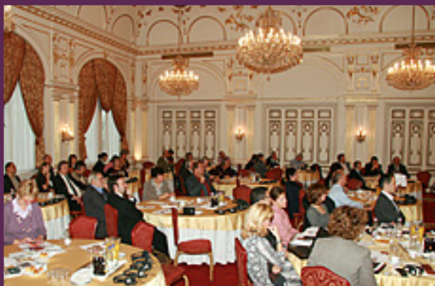
► A hallgatóság