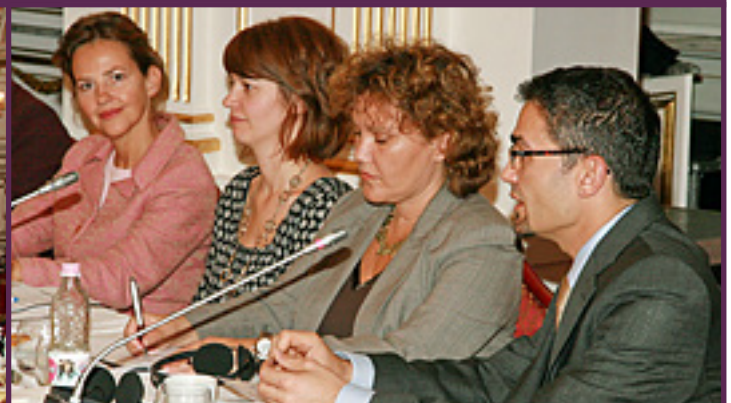
► Nemzetközi szakértők