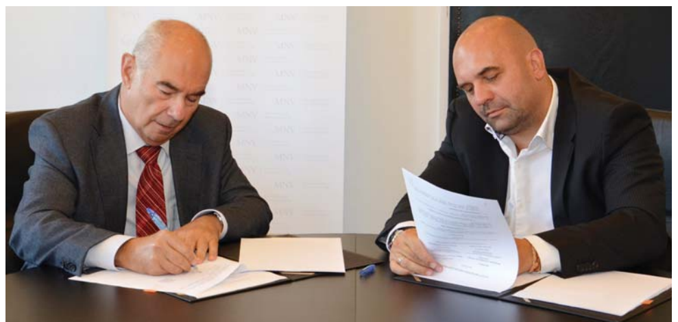
Az MGYOSZ elnöke és az MNV Zrt. vezérigazgatója együttműködési megállapodást írt alá, mely a magyar vállalkozások segítségét szolgálja