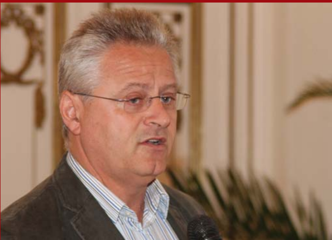
Szalma Botond, a Magyar Hajózási Országos Szövetség elnöke