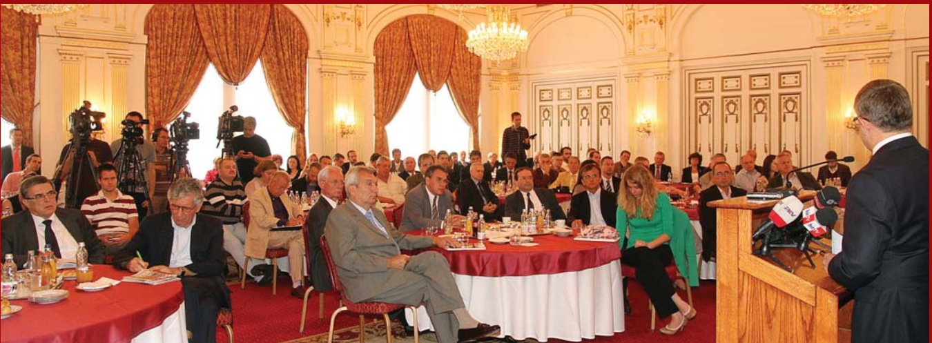
Sokan voltak kíváncsiak az új jegybankelnök terveire