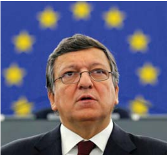
José Manuel Barroso elnök:

„A REFIT programmal a Bizottság minden korábbinál átfogóbb lépéseket tesz annak érdekében, hogy az uniós jogot egyszerűbbé tegye, végrehajtását pedig megkönnyítse. A szubszidiaritás és az arányosság elvének állhatatos alkalmazása nem fogja megfosztani a polgárokat és a vállalkozásokat azokról a fontos előnyöktől, melyeket az uniós szabályozás, különösen az egységes piacot megteremtő szabályok biztosítanak számukra.”