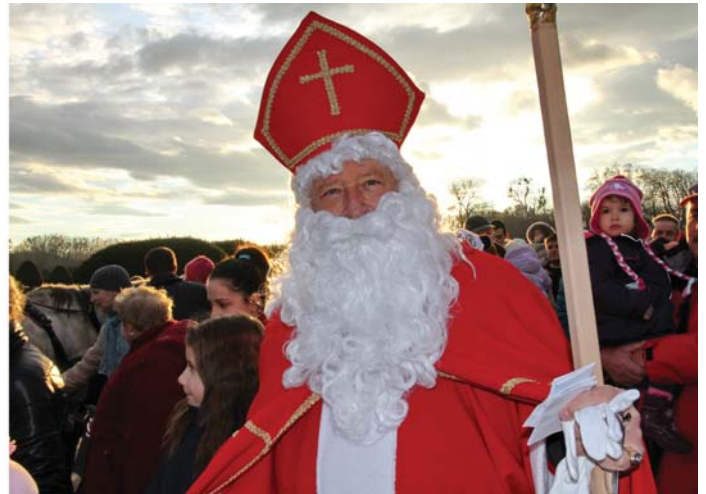
Vámos Judit fotóin herceg Esterházy Antal a Máltai Lovagrend avatáson és Fertődön az Esterházy-kastélyban mint Mikulás vendégül látja a környékbeli gyerekeket.

üzletet a Városház utcában, amit 49-ben államosítottak és akkor elment az MTI-hez (akkor Magyar Fotónak hívták) laborvezetőnek. Majd nagyapával 53-ban találták meg a Fő utcában azt az üzlethelyiséget, ahonnan elindult a Vámos Fotó.