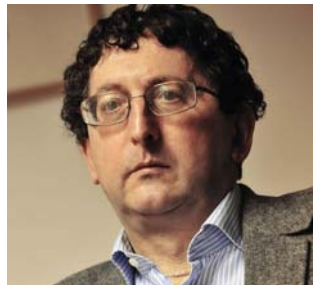
Csaba László közgazdász, egyetemi tanár, a Magyar Tudományos Akadémia rendes tagja

készség alacsony szintje általános, már az oktatásban is látható probléma, a sikeres vállalkozóknak ebben is példát kell mutatniuk. A Figyelőnél kifejezetten éreztem az ezt segítő hozzáállást, ezért a Figyelő Klub neve megegyezésünk alapján átalakult Figyelő-MGYOSZ Üzleti Klubra.