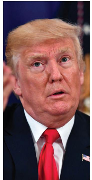
A Trump-adminisztráció világosan eltökélt a meglévő kereskedelmi szabályok, szokások átalakításában

Az az eljárás azonban megkérdőjelezhető, hogy nem elvek és közös, többoldalú viták mentén, hanem bilaterálisan kívánja az USA a szabályokat átalakítani. Bilaterálisan pedig mindig erősebb alkupozícióban van. A végeredmény akár egymásnak ellentmondó kétoldalú kapcsolatok szabálygyűjteménye is lehet, vagy egyes országokkal szemben a kapcsolatok szétzilálásával is járhat. A NAFTA tárgyalásokon az amerikai pozíció hallatlanul erős. Mexikó egyébként is törekeny, összehúzó gazdasága komoly kockázatokkal szembesül, Kanada folyó fizetési mérlege 8 éve negatív, a háztartások eladósodottsága minden összevetésben magas. Miközben a két szomszédal bonyolított teljes