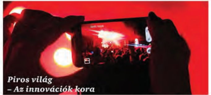
Piros világ – Az innovációk kora

A vállalatok és az egyének egymással versengve igyekeznek kielégíteni a fogyasztók igényeit. A szabályozás üteme nem tud lépést tartani az innováció ütemével. A digitális platformoknak köszönhetően rendkívüli befolyásra tesznek szert azok, akik egy díjnyertes ötlettel állnak elő. Aranykorukat élik a szakértők és a piaci részeket betöltő vállalkozások.