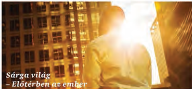
Sárga világ – Előtérben az ember

Virágzanak a társadalmi érdekeket előtérbe helyező, közösségi vállalatok. A közösségi finanszírozású tőke az etikus és feddhetetlen márkákhoz áramlik. Általánossá válik a dolgok értelmének és jelentőségének társadalmi szemléletű vizsgálata. Aranykorukat élik a kézművesek, termelők és az „új céhek”. Az emberi tényező nagy értéket képvisel.