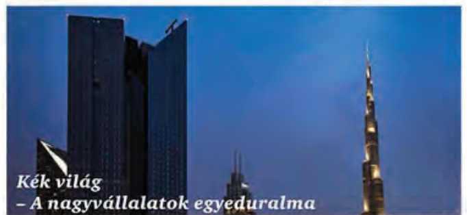
Kék világ – A nagyvállalatok egyeduralma

A vállalatok és az egyének egymással versengve igyekeznek kielégíteni a fogyasztók igényeit. A szabályozás üteme nem tud lépést tartani az innováció ütemével. A digitális platformoknak köszönhetően rendkívüli befolyásra tesznek szert azok, akik egy díjnyertes ötlettel állnak elő. Aranykorukat élik a szakértők és a piaci részeket betöltő vállalkozások.