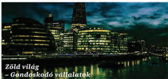
Zöld világ – Gondoskodó vállalatok

A társadalmi felelősségvállalás és a bizalom kiemelt helyen szerepel a vállalatok napirendjén. A demográfiai változásokkal, a klímaváltozással és a fenntarthatósággal kapcsolatos aggályok kulcsfontosságú tényezőkké válnak a vállalatok életében.