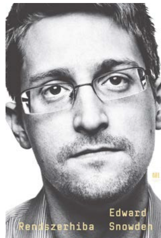
Edward Snowden: RENDSZERHIBA

Pályájának genezise: „9/11 után a hírszerzőket büntudat gyötörte, amiért hiába örködtek, nem akadályozták meg a támadást, mely a legpusztítóbb volt, amit Pearl Harbor óta az ország ellen intéztek. Válaszlépésként az ország vezetői igyekeztek olyan rendszert ki-