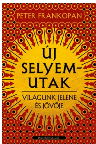
ÚJ SELYEMUTAK Világunk jelene és jövője