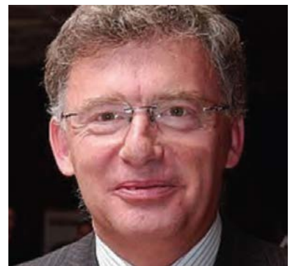
Vértes András, a GKI Gazdaság- kutató Zrt. elnöke, az MGYOSZ alelnöke

Mire számítsunk? Eleinte sokkal nehezebb időkre, mint 2-3 évvel ezelőtt. A vírus, a vírusok egyelőre valószínűleg velünk maradnak. Az állami költségvetés továbbra is nagyon jelentősen deficites lesz, az államadósság alig csökken. A GDP növekedése 5% körül várható, a folyó fizetési mérleg 4,5% körüli deficitet fog mutatni. A novemberi infláció már 7,4%, rendkívül magas. Szeretném az EU-trendek térdhódítását, egy nyugodtabb és okosabb Magyarországot.