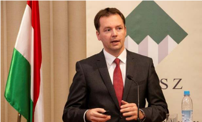
Izer Norbert, a Pénzügyminisztérium államtitkára